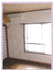
殺風景な雰囲気のリビングダイニング