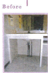
以前の洗面室は、簡素な雰囲気の洗面台で、暗い感じがする空間だった