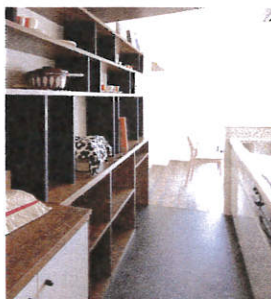
キッチン回りの床材は、汚れやキズに強いタイプの黒の長尺シートを採用。素材のもつシックな風合いが大人っぽい雰囲気