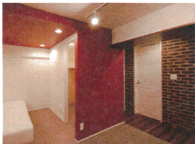
洗面室との仕切り壁にはアンティークレンガのようなブリックタイルを張り、店舗のイメージに。赤い仕切り壁の奥はベッドスペースとクロゼット